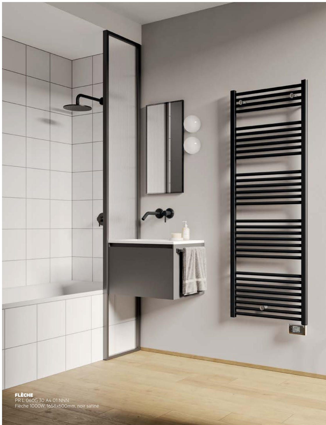
FLÈCHE PR L 060G 30 A4 01 NNN Flèche 1000W, 1658x600mm, noir satiné