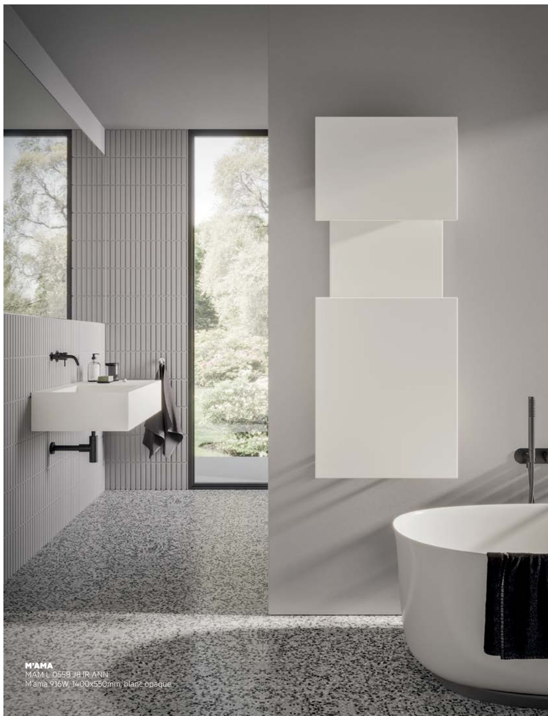
M'AMA MAM L 055B J8 IR ANN M'ama 916W, 1400x550mm, blanc opaque