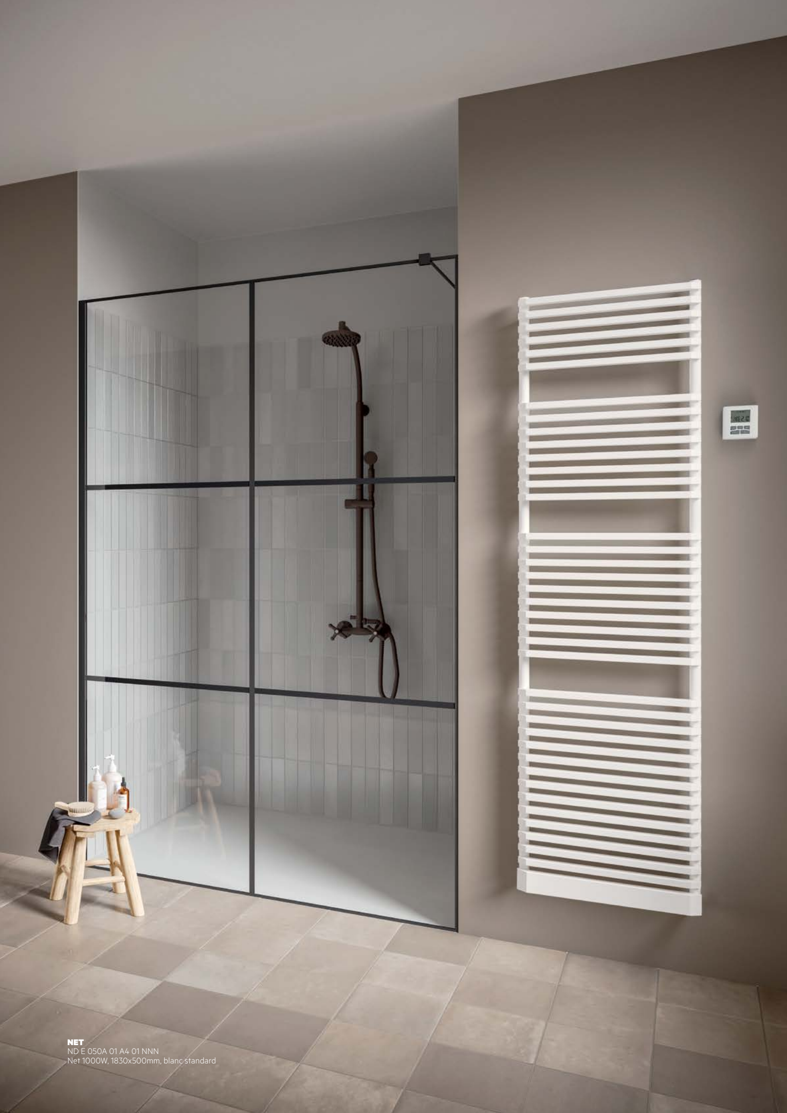
NET ND E 050A 01 A4 01 NNN Net 1000W, 1830x500mm, blanc standard