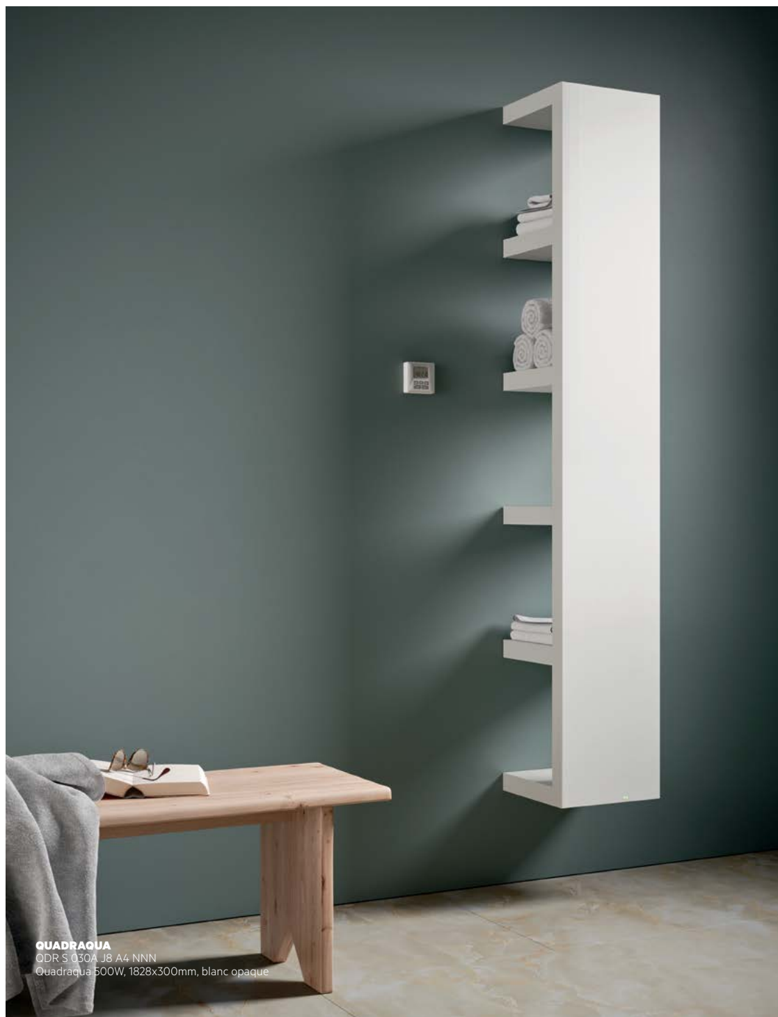
QUADRAQUA ODR S 030A J8 A4 NNN Quadraqua 500W, 1828x300mm, blanc opaque