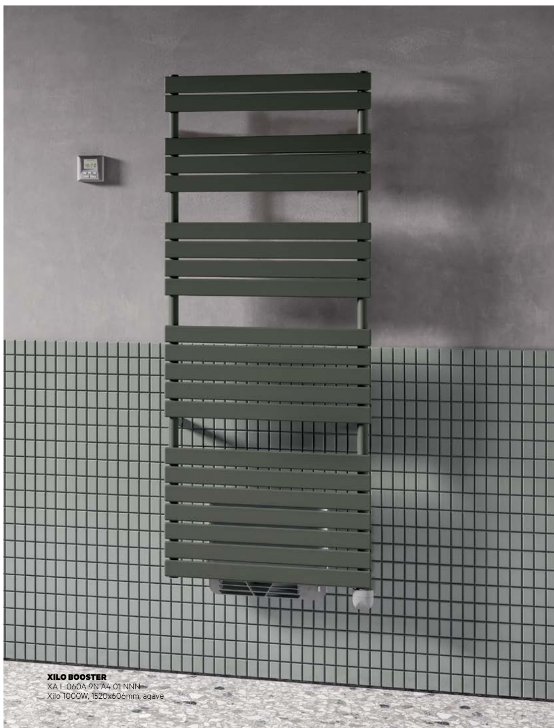
XILO BOOSTER XA L 060A 9N A4 01 NNN Xilo 1000W, 1520x606mm, agave